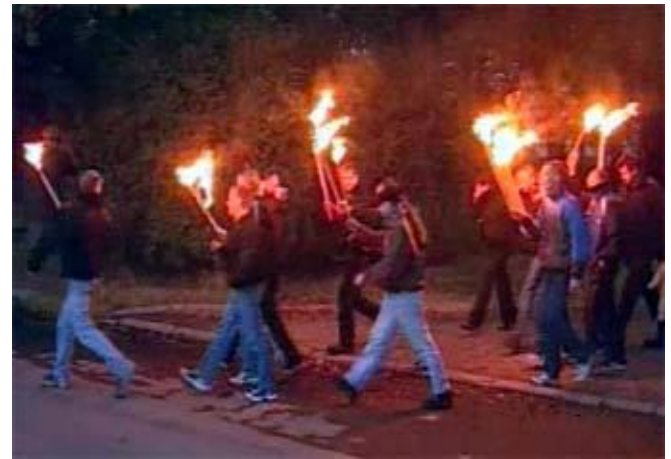
Скинхеды. Факельное шествие в Петербурге.